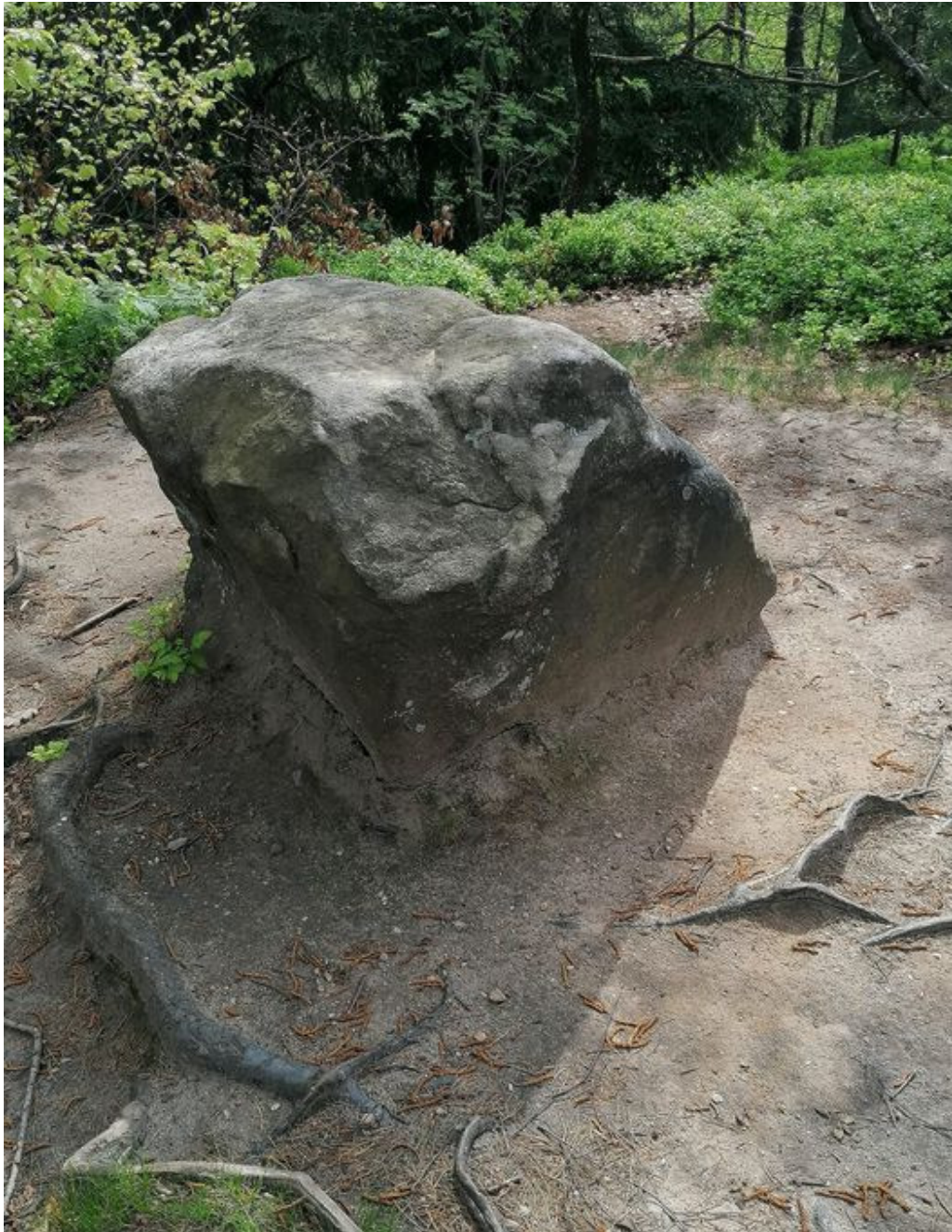
Obrázek č. 1/2