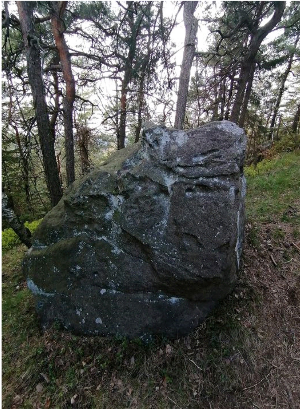
Obrázek č. 1/2

Socha „býčího“ Velese s rohy – východní strana