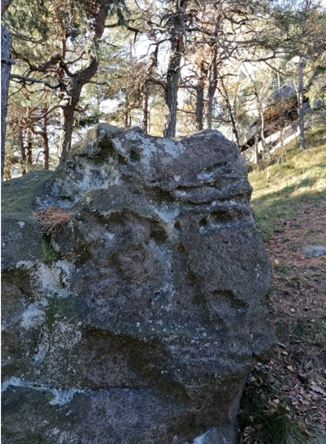
Obrázek č. 1/3

Socha Velese s rohy – východní strana (bližší záběr)