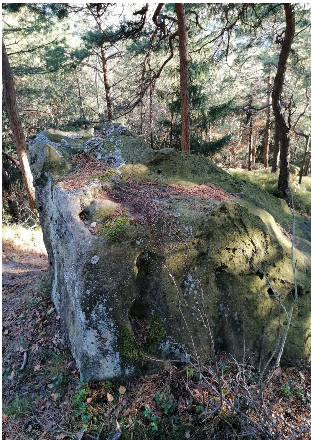
Obrázek č. 1/5