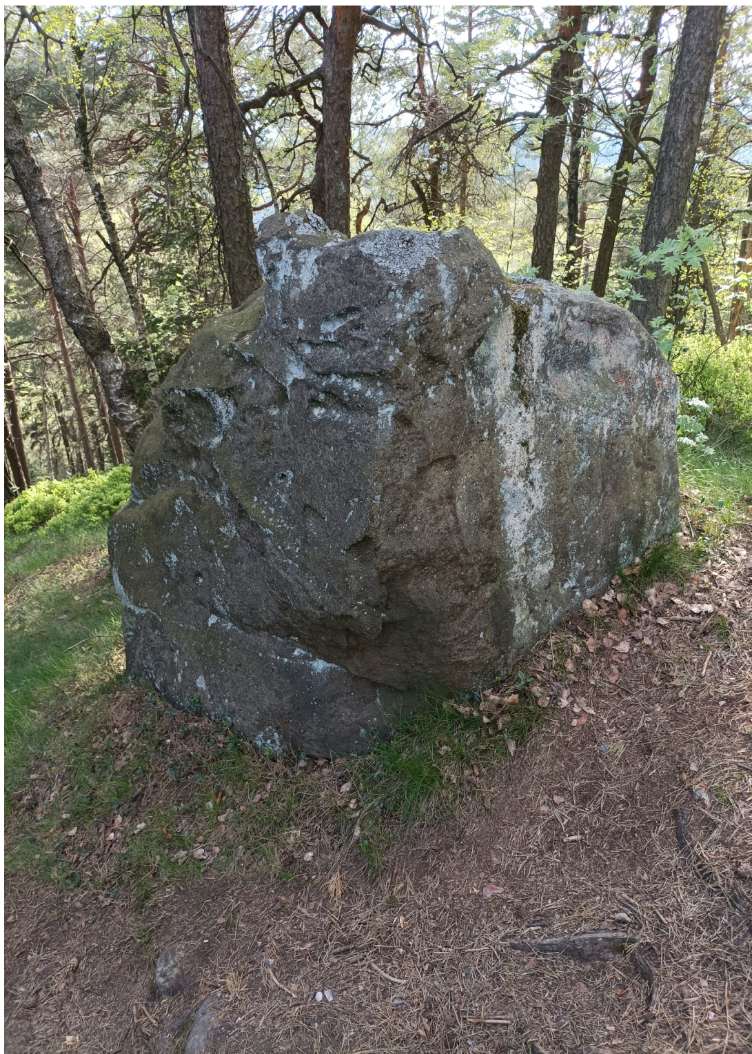
Obrázek č. 1/4