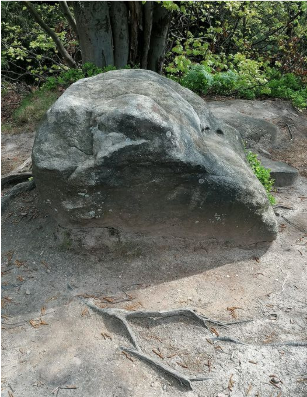
Obrázek č. 1/3