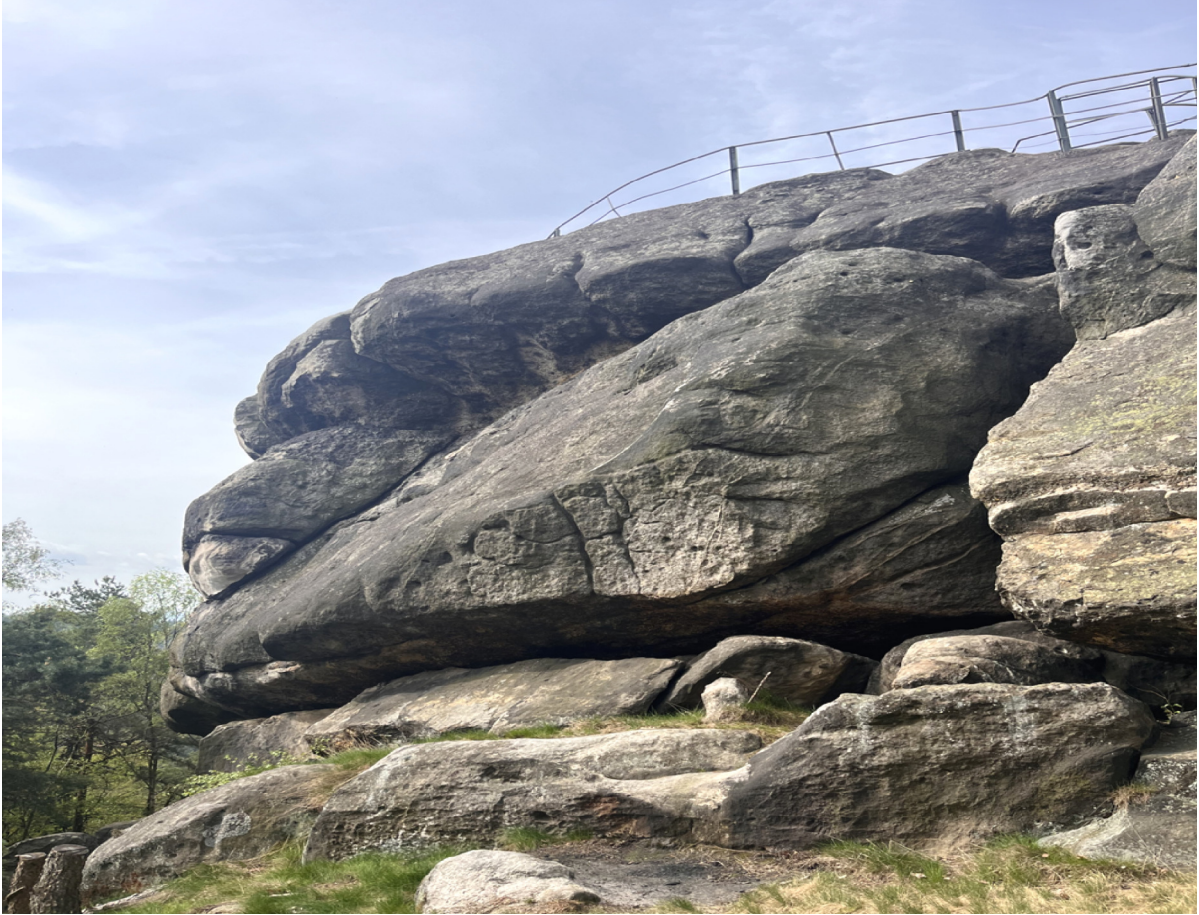
Obrázek č. 1/3-1